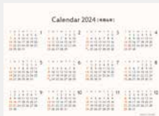
※12月裏面には年表を掲載