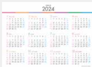
※12月裏面には年表を掲載