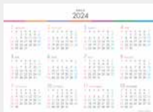
※12月裏面には年表を掲載