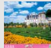
3-4月 / シェリーシュルワールヒヤロンヌ間のロワール渓谷 (フランス)