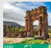
5-6月 / ジェミラ (アルジェリア)