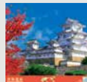
9-10月 / 姫路城 (日本)