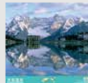
1-2月 / ドロミーティ (イタリア)