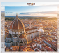
9-10月 / フィレンツェ歴史地区 (イタリア)