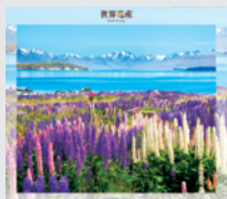
1-2月/テウヒポウナム・南西ニュー ジーランド(ニュージーランド)