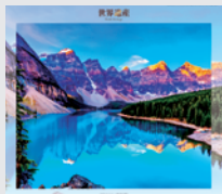
7-8月/カナディアン・ロッキー 山脈自然公園群(カナダ)