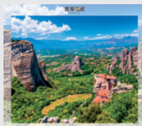
3-4月 / メテオラ (ギリシャ)