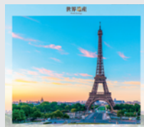
5-6月 / パリのセーヌ河岸 (フランス)