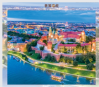
11-12月/クラクフ歴史地区 (ポーランド)