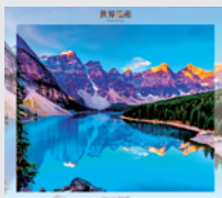
7-8月 / カナディアン・ロッキー 山脈自然公園群(カナダ)