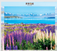
1-2月 / テウヒボナム・南西ニュー ジーランド(ニュージーランド)