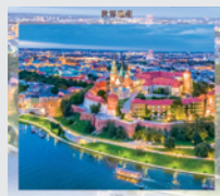
11-12月 / クラクフ歴史地区 (ポーランド)