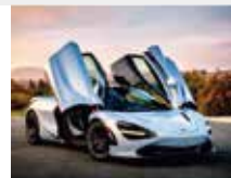
9-10月 マクラーレン 720S