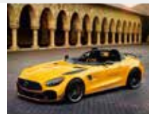
7-8月 パッション GT R スピードレジェンド