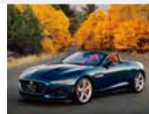
11-12月 ジャガー F-TYPE コンバーチブル