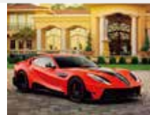
3-4月 マンソリー・スタローン 812