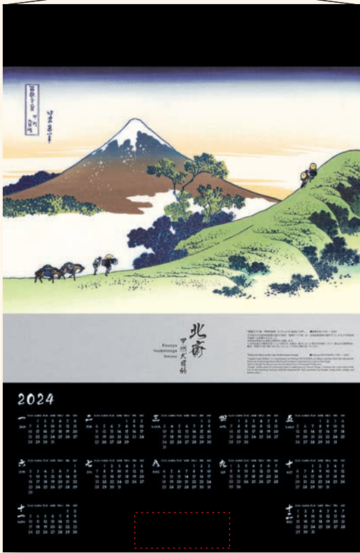
「富嶽三十六景-甲州大目峠」 葛飾北斎 画